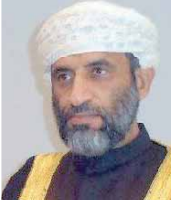
بقلم : الدكتور / محمد بن سليمان الراشدي عضو اللجنة الوطنية لحقوق الانسان رئيس اللجنة العربية الدائمة لحقوق الانسان

الحق في اللغة، هو الثابت الذي لا يسوغ إنكاره، وجمع الحق حقوق وفي الاصطلاح: الحق هو الحكم المطابق للواقع. والحق ضد الباطل. ويعرف الحق بأنه ما قيم على العدالة والإنصاف ومبادئ الأخلاق والحق في الشريعة الإسلامية لفظ يشير إلى الله عز وجل وهو اسم من أسمائه الحسنی جل شأنه. ان الحضارة العربية الاسلامية والدين الاسلامي لعبا دورا مهما في تطور وتنمية فكر الانسان ووعيه بحقوقه وحرياته الاساسية. كما أن الحضارة العربية الاسلامية قدمت مساهمات مهمة على مر العصور.