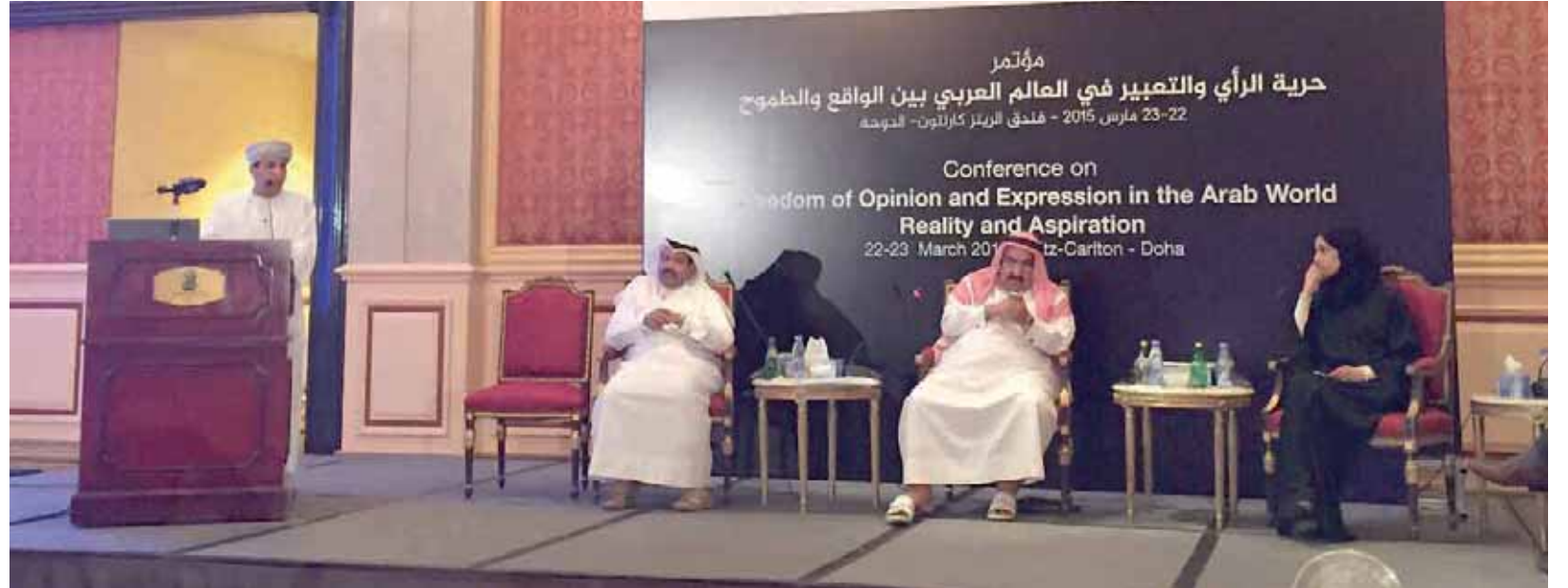
جانب من مؤتمر حرية الرأي والتعبير في العالم العربي بين الواقع والطموح